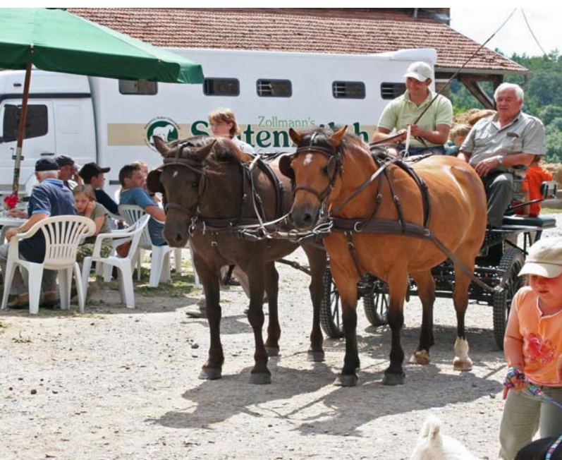
Attraktion für Pferdeliebhaber: Kutsche des Kurgestüts Hoher Odenwald.